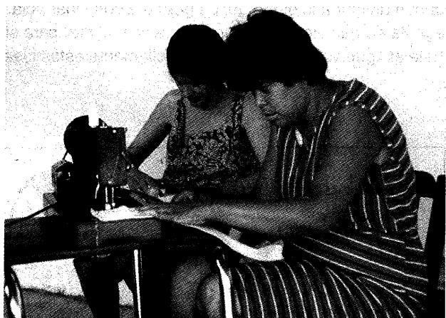
En un programa comunitario todos ayudan. Aquí la mamá de un niño con polio cose calcetines (los cuales se usan bajo los yesos).

Algunos niños tienen deshabilitades múltiples. Por eso es difícil limitarnos a atender sólo unas cuantas deshabilitades, y no otras. Debemos tratar de satisfacer las necesidades del niño en general, teniendo en cuenta a su familia y a su comunidad. De todos modos, casi siempre es mejor comenzar de una manera más o menos limitada, con un enfoque en el área en que la gente quiera participar . Deje que las cosas se extiendan desde allí, a medida que aparezcan nuevas inquietudes y que más gente empiece a participar.