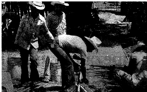
En el pueblo de Ajoja, México, más de 60 adultos ayudaron a construir un camino de cemento desde el centro de rehabilitación hasta la calle principal.

En un programa dirigido 'desde abajo', la comunidad participa de otro modo. El programa se desarrolla dentro de una comunidad o un barrio según las necesidades y los deseos de los participantes. Para poner en marcha el proyecto, tal vez el programa necesite la ayuda de una persona de fuera, con ciertos conocimientos de rehabilitación y habilidad para organizar a la gente. Pero las personas del lugar, sobre todo los deshabilitados y sus familiares, toman las decisiones principales. Ellos pueden adaptar ideas de otros programas y escuchar las sugerencias de los expertos, pero no simplemente los imitan ni siguen sus órdenes. De los consejos y la información que reciben, escogen lo que les puede servir para planear las actividades necesarias y posibles en su comunidad, para sus niños.